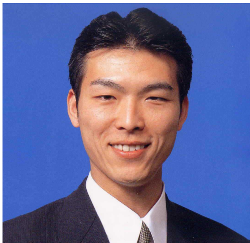
発行者 関野たかなり

公民館のつどいは、午前と午後に分かれてディスカッションを行いました。午前中は、公民館で行われている自主グループ（健康・保育室・子育て・国際交流・青少年・地域「福祉」）の5つの問題点や解決策について話し合いました。午後は、5つの自主グループの参加者が5班に（1班、各自主グループの方がいきわたる様に）別れて話し合いを行い、各班の代表者が市長になったつもりで「政策宣言」を作成し発表していきました。5班とも各自主グループの方がいる為か、発表された内容は、みなさん同じ様な内容でしたが、市民の本当の声を聞いたような気がしました。 心の豊かさ 市民参加で市政を変えていきたい 小学校の空き教室の解放 0歳児保育を創って欲しい 母父に育児友達を！ 人と人のつながりが欲しい 市民企画のイベント開催がしたい など多数の意見がだされました。 この様な問題についても、上記の（おもて面）の住民情報ネットワークを使うことにより東大和市の財政を圧迫せず、市民へのサービスが充実していくと考え